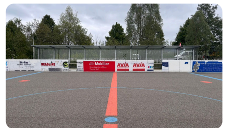
Bandenwerbung direkt am Spielfeld