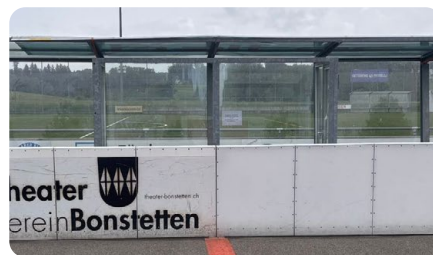
Spielerbank / Strafbank im Glasbereich