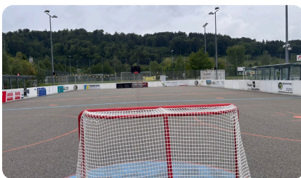
Spielfeld & Bandeninnenseiten

Alle Preise verstehen sich pro Saison . Bei einem Vertrag über 3 Saisons sind Produktion und Installation der Werbebande im Preis inbegriffen . Individuelle Kombinationen sind jederzeit möglich. Die Website-Präsenz ist bei jeder Einzelfläche und jedem Paket inklusive – alle Sponsoren werden auf unserer Website aufgeführt.